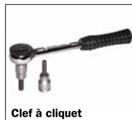
Clef à cliquet