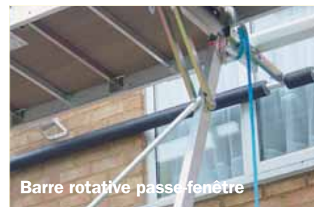
Barre rotative passe-fenêtre