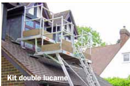
Kit double lucarne